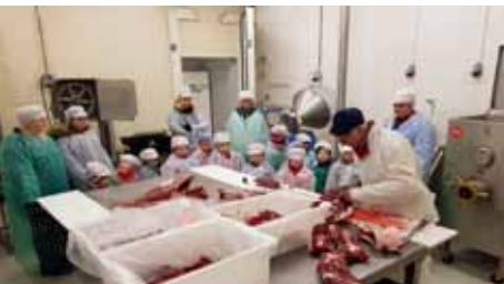
Solsida barnehage på besøk hos Øre Vilt.

De to eldste gruppene i Solsida barnehage har vært på besøk på Øre Vilt i Skeidsdalen. Vi fikk god omvisning rundt om på slakteriet, og fikk se mye av det som skjer etter at dyra har ankommet slakteriet. Vi sitter igjen med store opplevelser etter en spennende dag!