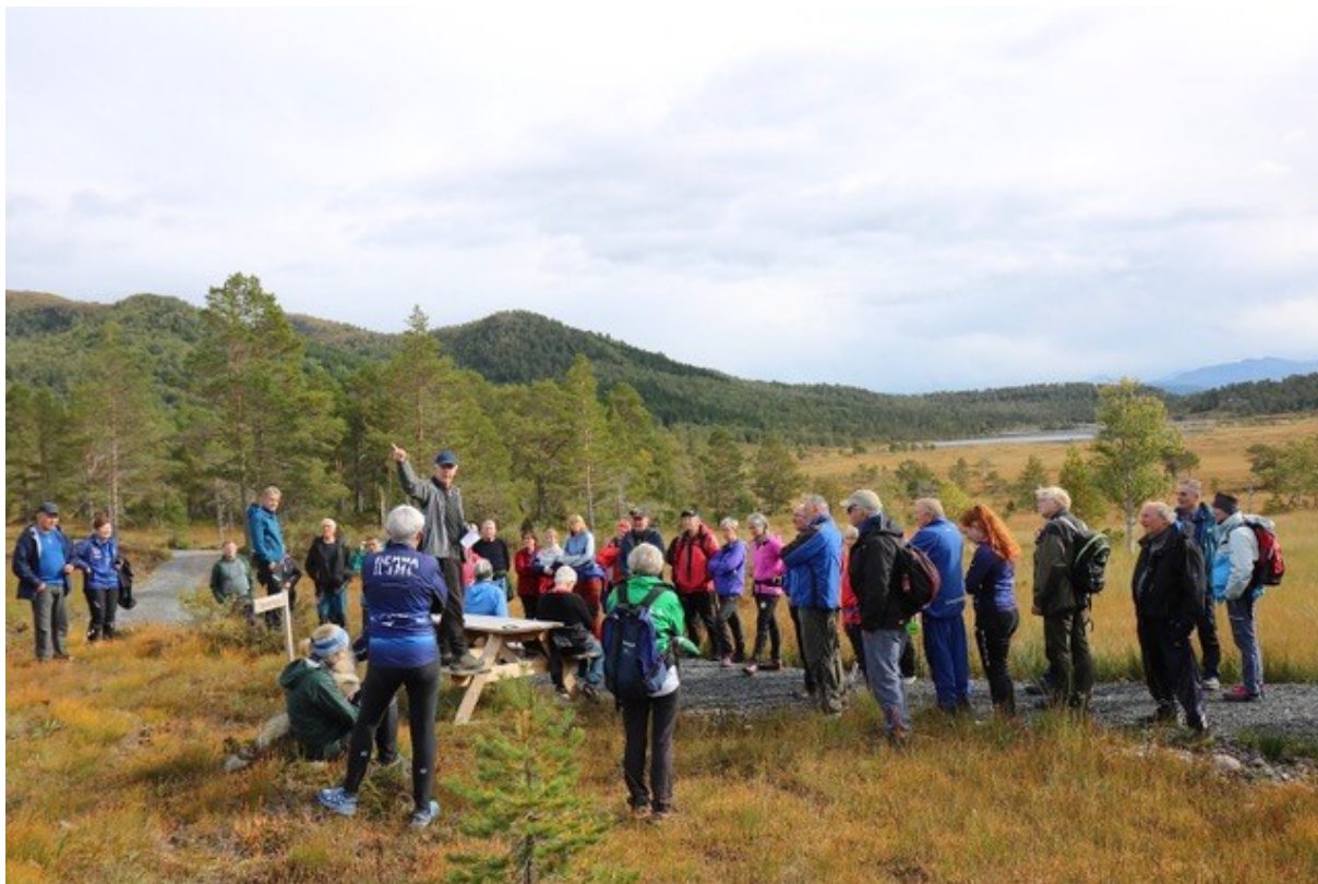
Fellestur med ordfører og kjentmann rundt Flemsetervatnet 2020.