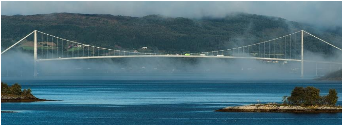
Figur 1. Gjemnessundbrua.

Omlag 150 meter vest for planområdet ligger «Smihaugen» (Askeladden Id144817), en jernvinnelokalitet fra jernalder/middelalder. Informasjonen er hentet fra kulturminnedatabasen Askeladden.