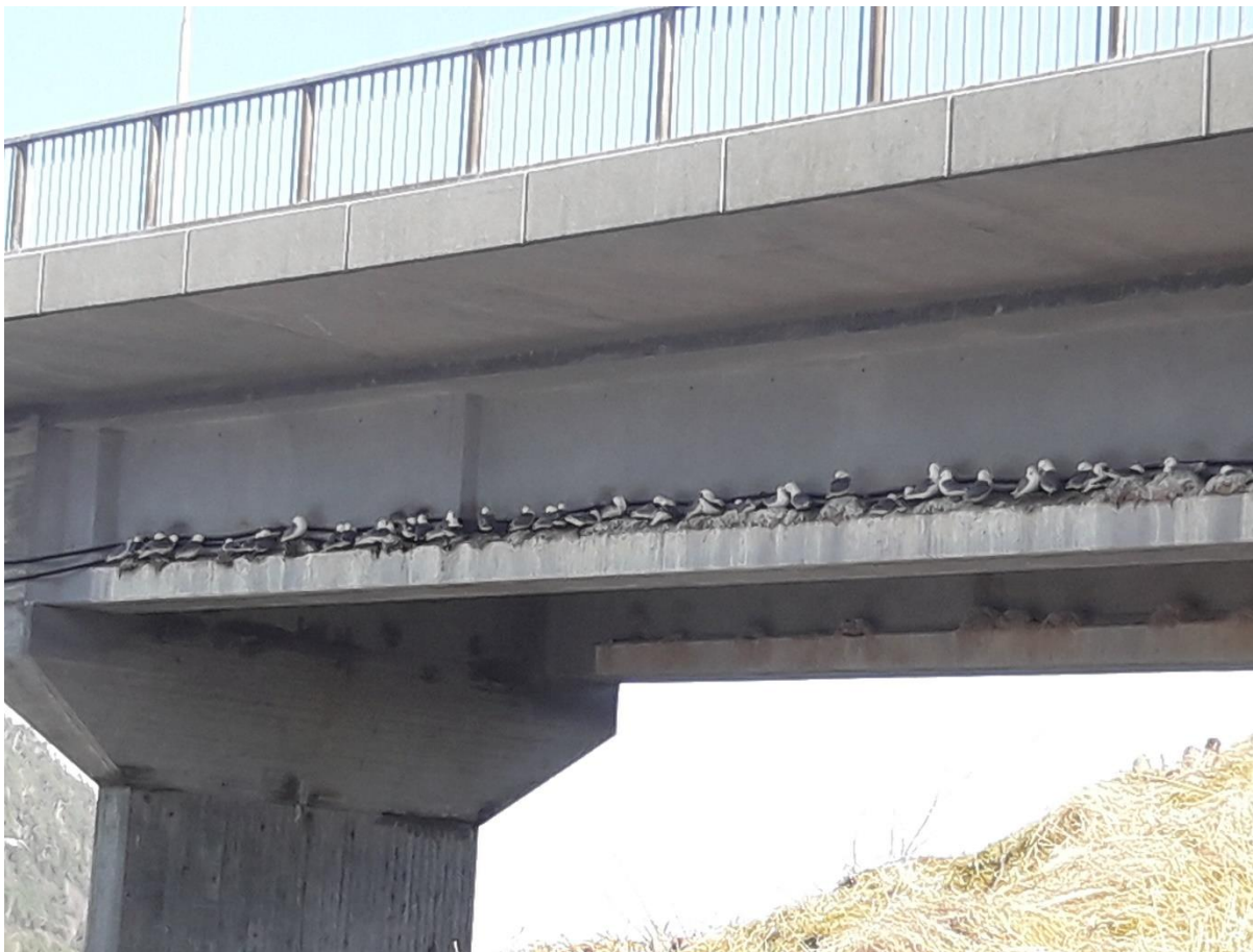
Figur 2. Hekkende krykkjer under Gjemnessundbrua.

Planområdet ligger inntil Gjemnessundbrua hvor det finnes en større koloni krykkje ( Rissa tridactyla ). Krykkje er en art av stor forvaltningsmessig interesse og er på rødlista for arter kategorisert som EN (sterkt truet). Arten har hatt en tilbakegang på 50-80 % de siste 10 år, hvor reduksjonen eller dens årsak ikke nødvendigvis er opphørt, forstått eller reversibel. Det ble i 2014 gitt støtte fra Fylkesmannen til bestandskartlegging av krykkje på Nordmøre, der lokaliteten på Gjemnessundbrua inngikk. Det ble på denne lokaliteten telt 1000 par i 2012 og 1008 par i 2014, og bestanden på lokaliteten synes ut fra dette å være stabil. Kommunen er ikke kjent med at det er foretatt tellinger etter 2014.