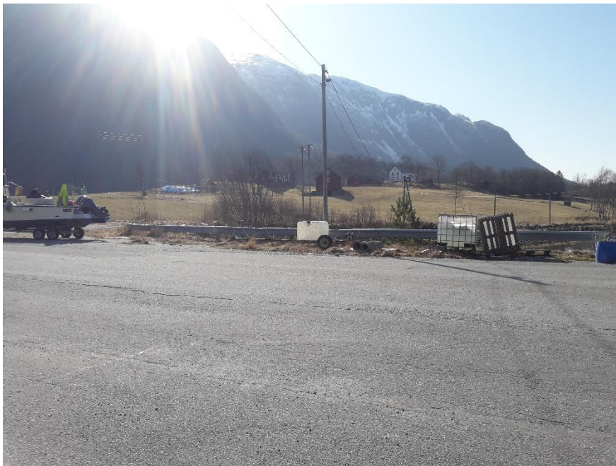
Figur 6. Rasteplass som omreguleres til parkering.

Delen av rasteplassen som ligger innenfor arealet som er solgt omreguleres til annen næring. Hensikten med salget og reguleringsendringen er å legge til rette for fiskeri. Rasteplassen har i liten grad blitt benyttet til formålet og kommunen veier derfor behovet for å bruke arealet til aktiviteter knyttet til næring tyngst. Arealet som er avsatt til rasteplass på kommunens eiendom omreguleres til parkering. Dette gjøres for å rydde opp i parkeringssituasjonen til småbåthavna. Kommunen mener det er et større behov for parkeringsplasser enn rasteplasser på dette området. Området er allerede asfaltert og omreguleringen medfører ingen praktiske endringer. Det er imidlertid ingenting i veien for at parkeringsplassen benyttes til rasting, men parkering for brukere av småbåthavna har førsterett. Dette reguleres i bestemmelsene.