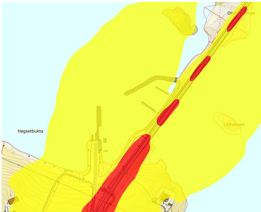
Figur 4. Støysonekart.

Hele planområdet ligger innenfor gul støyzone (55-65 dB). Informasjonen er hentet fra Statens vegvesens karttjenester via Gislink.