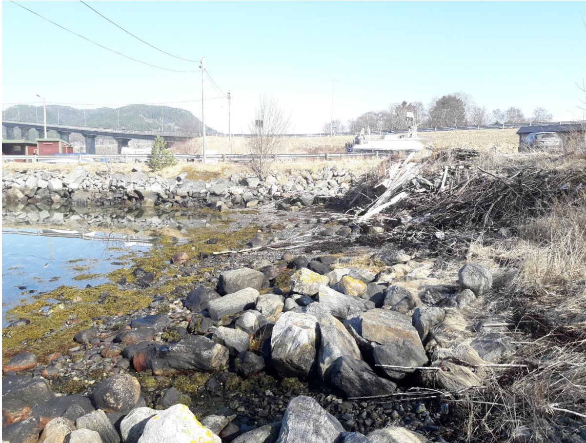
Figur 3. Område avsatt til badeplass i gjeldende reguleringsplan benyttes til tømming av hageavfall. Sett mot øst.